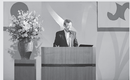
▲松浦会頭による意見発表