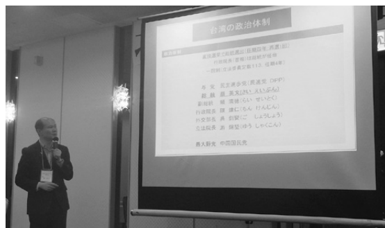
粘處長様による講演会

8月9日に令和5年度総会を4年ぶりに開催しました。総会終了後の講演会では、台北駐日経済文化代表處 札幌分處 粘處長様にご講演いただきました。