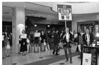
岩見沢ナイトのご案内

懇親会終了後には岩見沢ナイトを開催し、200人を超える方が岩見沢市内で2次会に向かわれ、さらに多くの方が3次会・4次会と岩見沢の夜のまちを堪能されました。