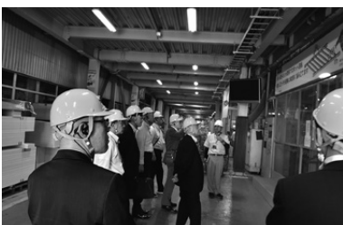
セキスイハイムを視察